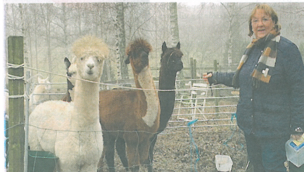
Ulla-Lena älskar sina alpackor. Här ser vi från vänster Firesone, Galaxy och True Knight "Ture".