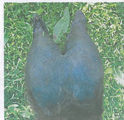
Den speciella trampdynan med två tår.